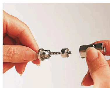
Montage mittels ASS Klemmring Assembly with ASS Clamping ring