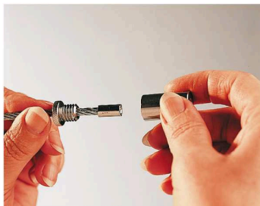
Montage mittels ASS Zylinderterminal Assembly with ASS Cylindrical terminal